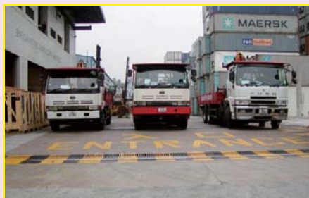
運送零件之貨車(物流部)